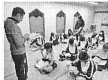
▲室長会議で日程確認