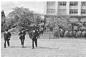
▲北館・本館ともふざける姿なし

普段から落ち着いて行動することや、あいさつなどの声かけをすることが、万が一の時にお互いの命を守ることに繋がります。災害情報はインフォメーションではなく、コミュニケーションでなければならないからです。新しい環境に慣れた今頃が、いちばん油断しがちです。大型連休中には、災害から身を守るために何をすべきかをご家庭でもお話しください。