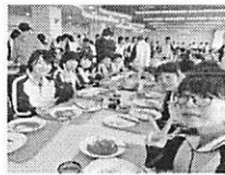
▲同室の仲間と一緒に食事