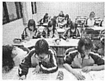
▲進路適性検査にマーク

引率教師の一人は、「バランスの良い印象で、これからが楽しみです」と話していました。