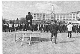
▲よく心構えをして行動する