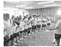
▲指揮者中心に校歌練習